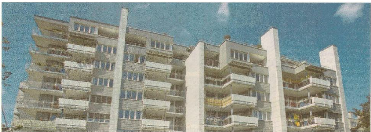
In der Überbauung Schachenfeld in Widen erfolgt seit 2005 die Verwaltung mittels einer mobilen Lösung von Avelon Cetex.