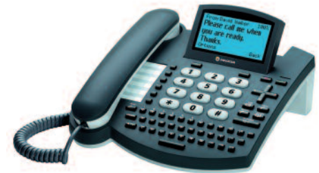
Das Tischtelefon GDP-04 GSM zum Office Flex Preisplan. Für CHF 40.- bei Abschluss eines 24-Monate-Vertrages + CHF 40.- für die SIM-Karte.